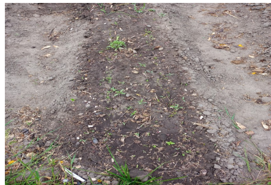
Ne pas pailler

La question se pose et la réponse est variée.